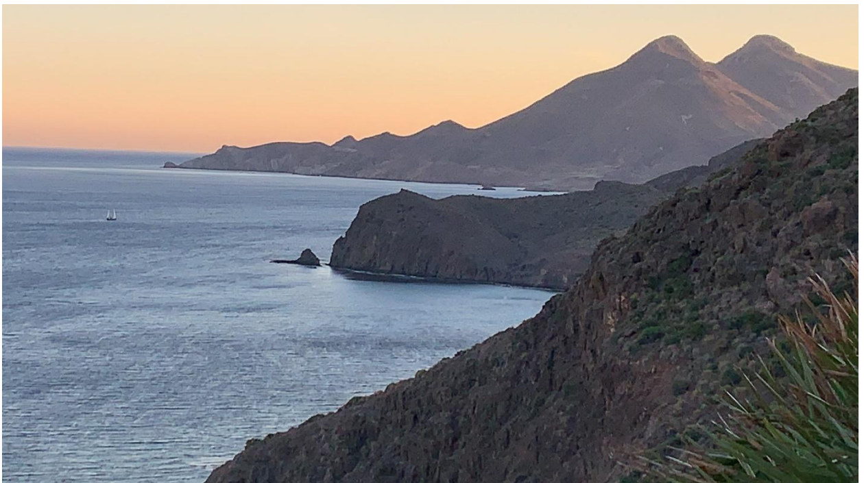
Los Frailes, at down