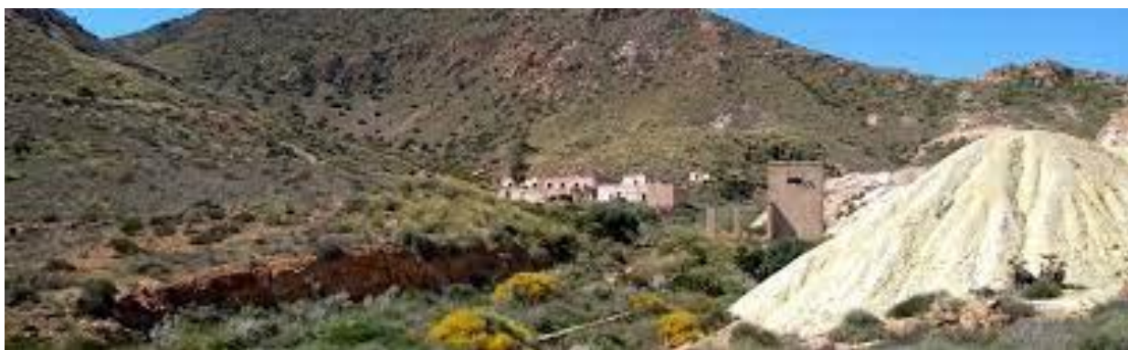
Poblado Inglés de San Diego. Si llegas a él, intuirás allí también su propia pista de Tenis (i Of Course !).

Esperemos que en el futuro se invierta en poner en valor este patrimonio, del que solo nos quedan sus ruinas en la zona indicada, y en el poblado de San Diego (ver mapa, a unos 30' andando), además de referencias como la "plaza del tenis", - actual campo de petanca para los locales y de restauración para todos -, que en su momento fue eso, la pista de tenis de los ingleses.