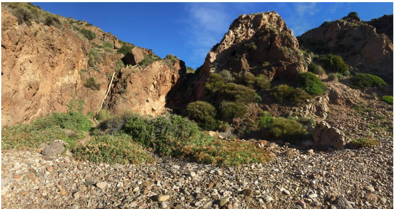
Detail of the access rope to the cove (white on the left wall).

Cala de la Higuera, or “de los Montes” . Boulders and stone. For good walkers, a 45-minute walk from the town center. Small cove open to the east. Guaranteed solitude and access by picking up a rope of good size.