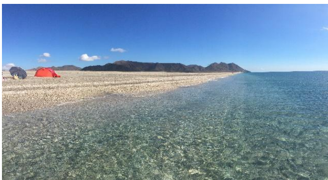
Playa de "La Fabriquilla". Cabo de Gata al fondo.

Estás en una posición central en el parque, por lo que puedes escoger entre un montón de playas. Si no te importa andar, puedes encontrar playas solitarias incluso en pleno Agosto.