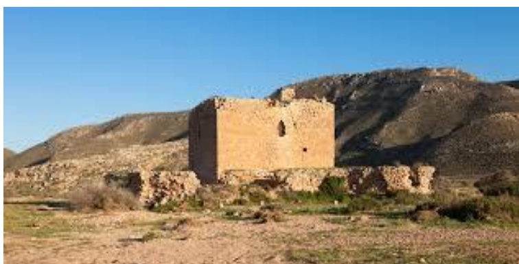
Alumbres Tower at sunset.