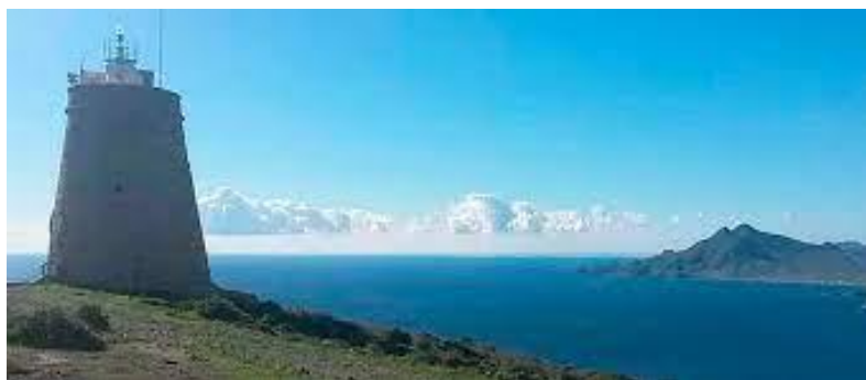
Torre de los Lobos. Al fondo, volcán de "Los Frailes".

Torre de Los Lobos. (La verás con facilidad al anochecer en cuanto veas el único faro visible desde la población). Puedes acercarte en coche hasta una verja, aparcar y remontar la montaña por unos 30 minutos. Probablemente las mejores vistas de la zona (no subas si el día es ventoso).