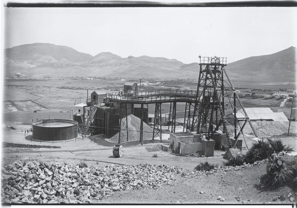
DORR facilities in 1932.

The DORR plant or “Los Ingleses” plant arose, the true origin of the town of Rodalquilar. You will see or intuit it, above the amphitheater, a little above the Church and in front of the park office. It is in this plant where gold is really