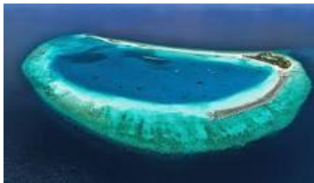
Imagen de un Atolón, con su laguna central.

Estos volcanes surgieron desde el fondo del mar, quedando algunos sumergidos (como muchos situados actualmente en nuestro cercano "Mar de Alborán"), y otros alcanzando la superficie y generando costas circulares con sus conos ocupados por aguas someras (los Atolones que seguramente recordarás de la