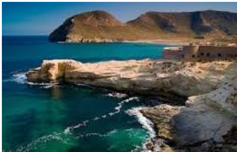
Bateria de San Ramón y El Playazo

Batería o Castillo de San Ramón situada en el "El Playazo" de Rodalquilar. A unos 4 km de Rodalquilar (de 2h a 3h ida y vuelta), o 5 minutos andando desde El Playazo