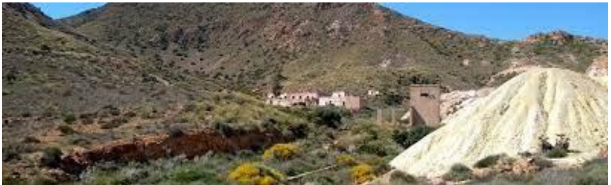
English town of San Diego. If you get to it, you will also sense its own tennis court there (Of Course!).

We hope that in the future they will invest in valuing this heritage, of which we only have its ruins in the indicated area, and in the town of San Diego (see map, about 30' walk away), in addition to references such as the " Plaza del Tennis", - current petanque field for locals and catering for all -, which at the time was that, the tennis court for the English.