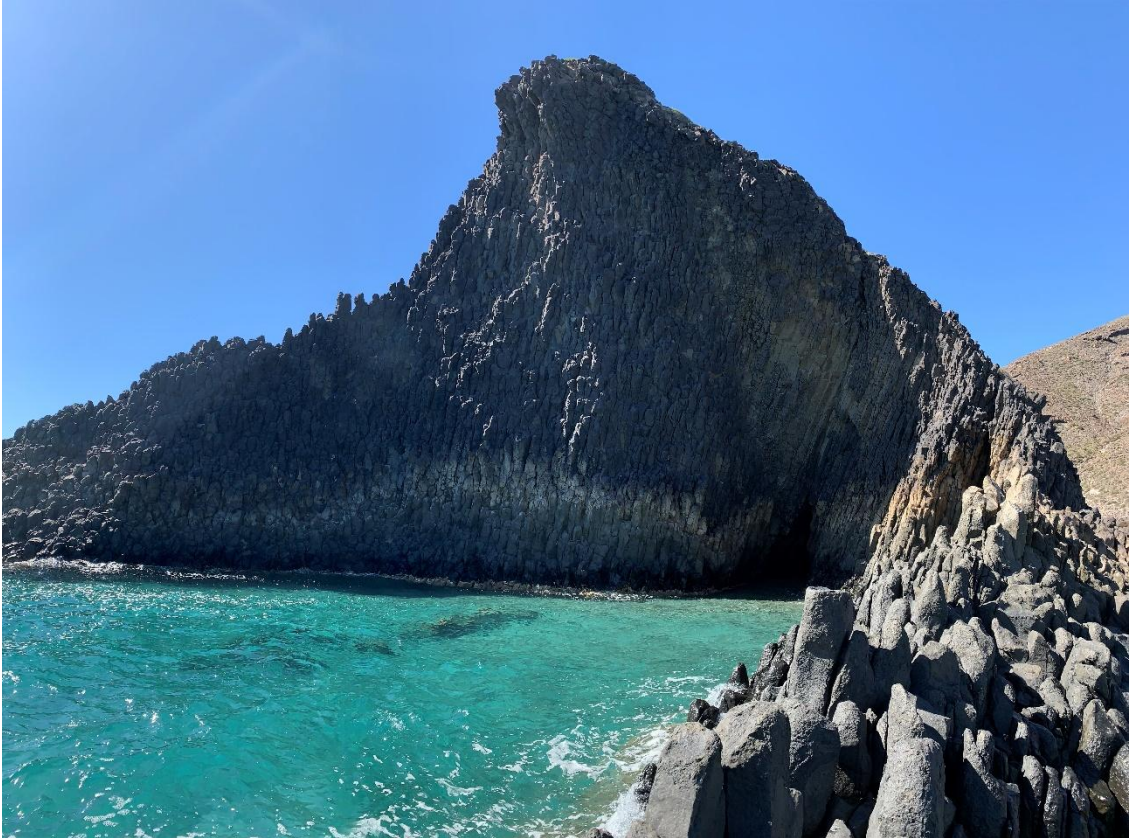
Playas cercanas a la Cala de Medialuna, al Sur de San José